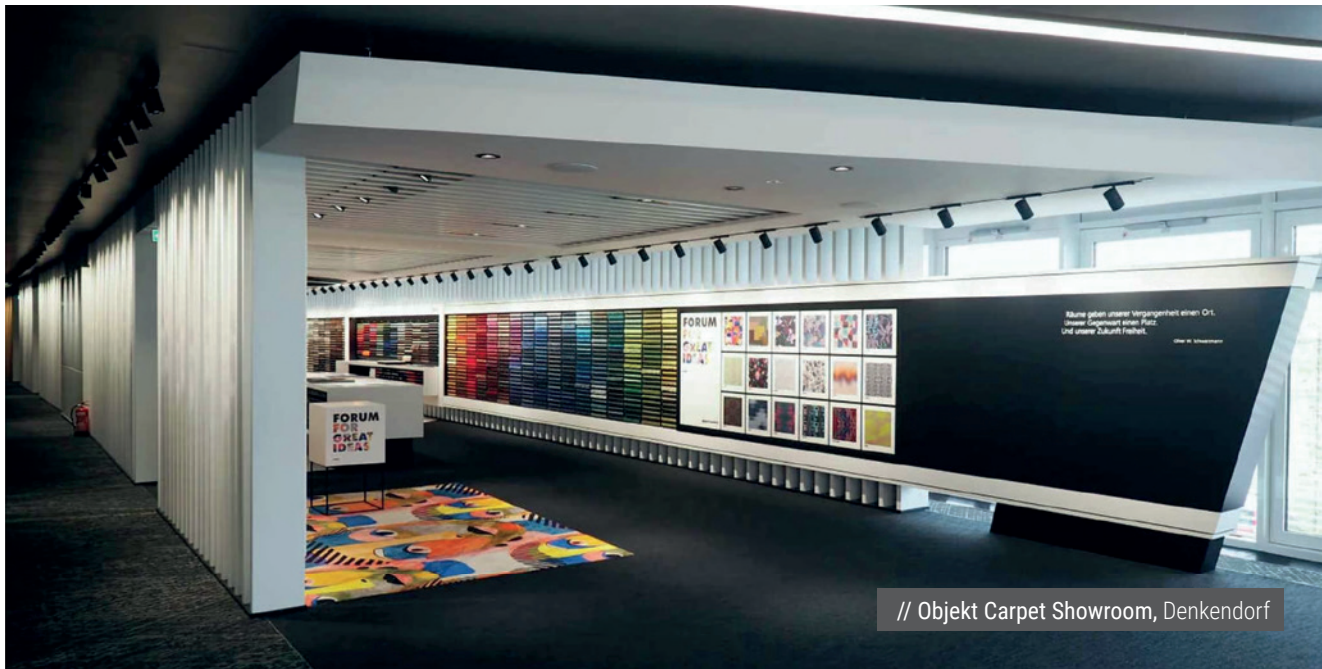
// Objekt Carpet Showroom, Denkendorf