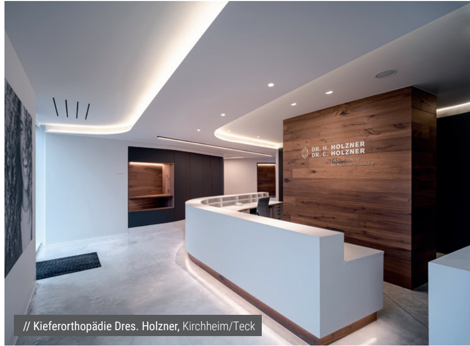
// Kieferorthopädie Dres. Holzner, Kirchheim/Teck