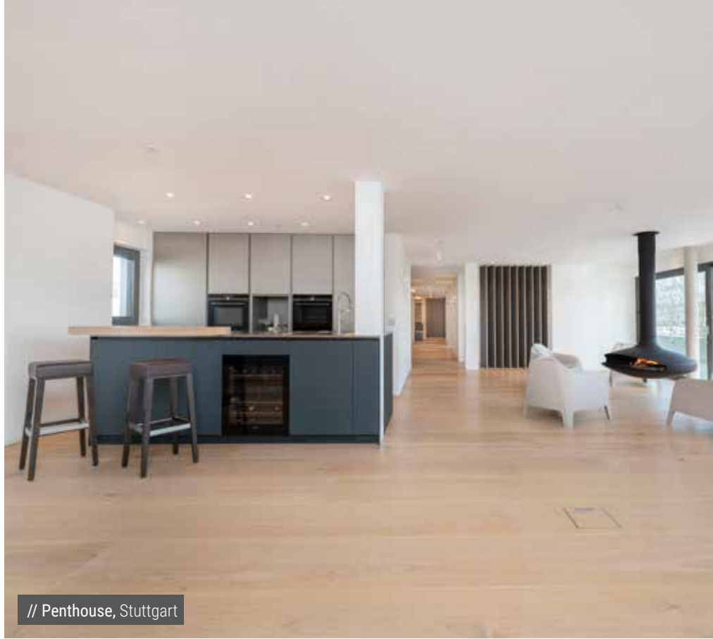
// Penthouse, Stuttgart