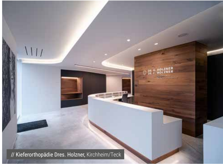
// Kieferorthopädie Dres. Holzner, Kirchheim/Teck