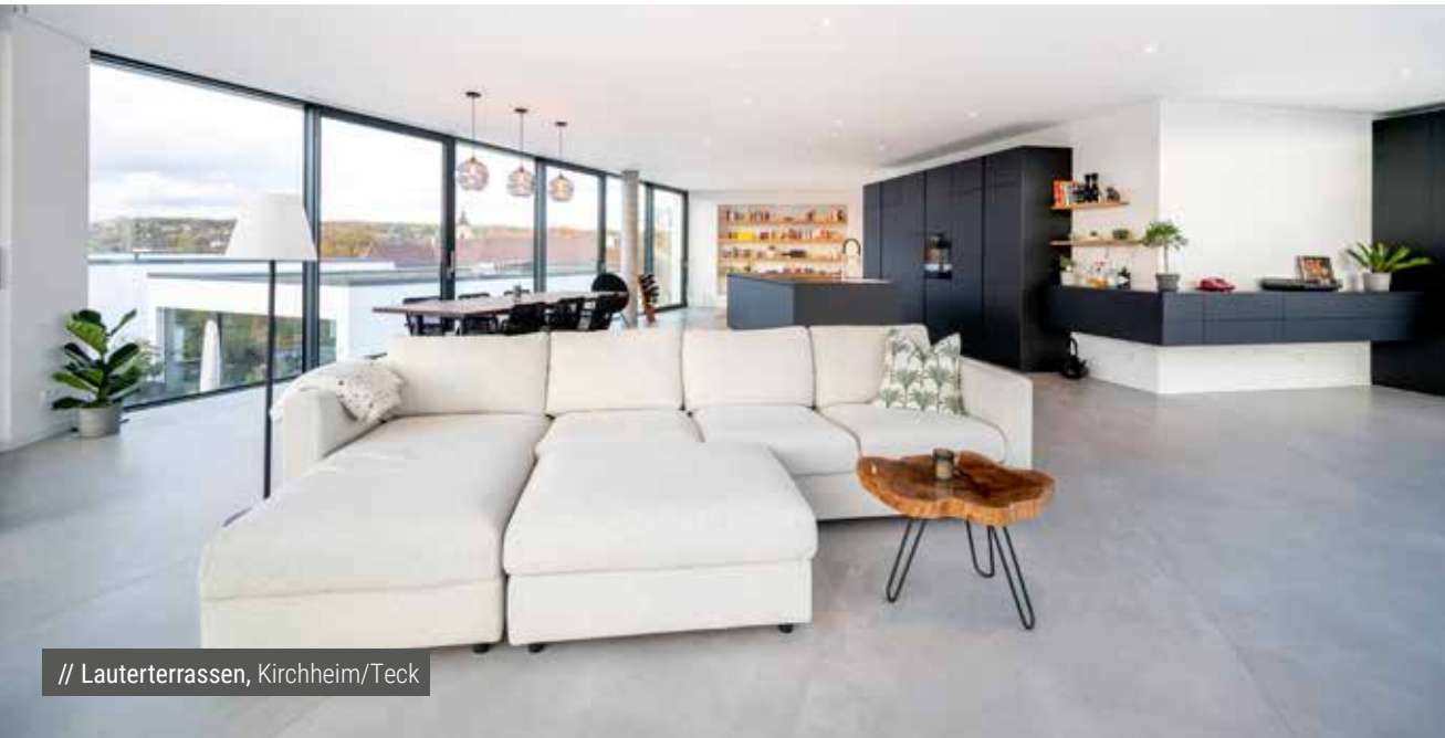
// Lauterterrassen, Kirchheim/Teck