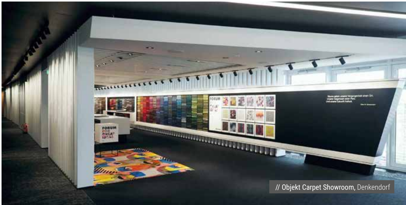
// Objekt Carpet Showroom, Denkendorf